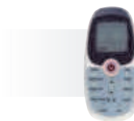
R09 (в комплекте)